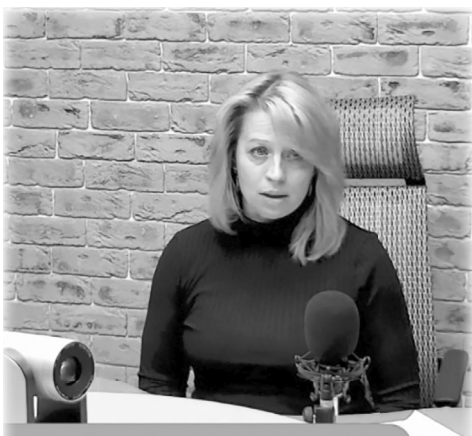
депутат Елизовского муниципального района